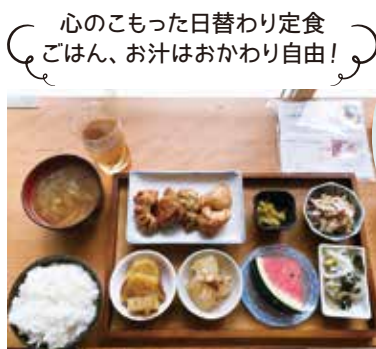
心のコもった日替わり定食 ごはん、お汁はおかわり自由！

今後は、「子どもの学習支援の場を創っていききたい。いろいろ課題はあるけど、地域のみなさんとつながって、解決していききたい」と話します。