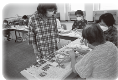
宮ノ口のちぎり絵サークルの方を講師に招き、作品をつくりました！