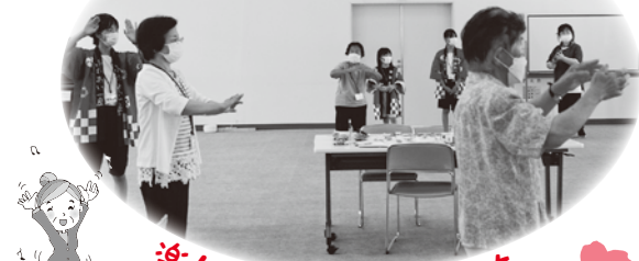
楽しく踊りをしました